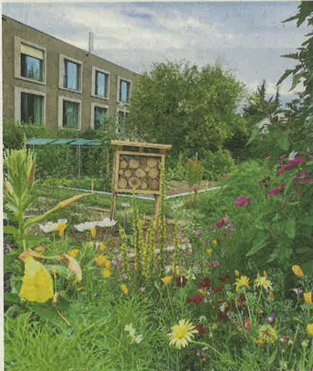
Mitten im Heilpflanzengarten steht das von einer Schülerin errichtete Insektenhotel.